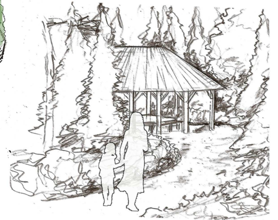
WIZUALIZACJA WIATY DRWNIANEJ